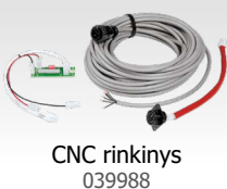
CNC rinkinys 039988