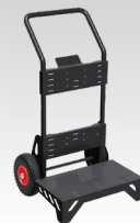
Rankinis vežimėlis 039568