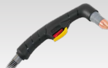
Degiklis MT-70 rankinis 70 A (50%) 6 m - 037502 12 m - 037519