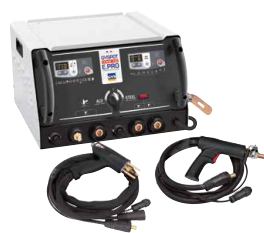
GYSPOT COMBI 230 E PRO - 021266