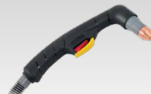
Handmatig bediende Toorts MT-70 70 A (50%) 6 m - 037502 12 m - 037519