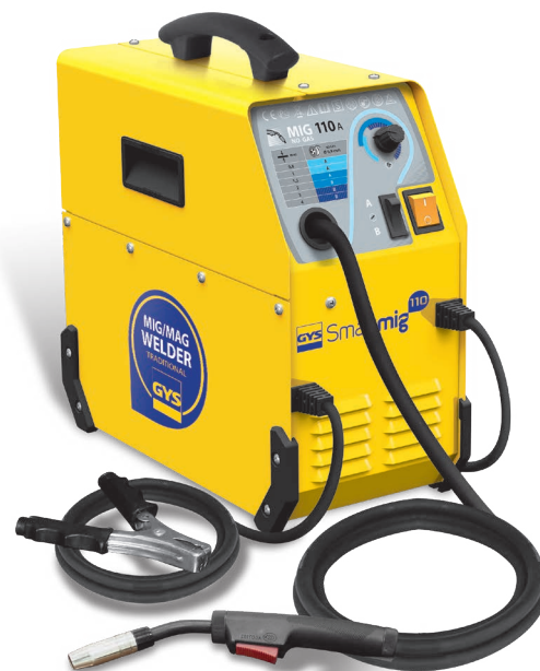
W zestawie kabel uziemiający i palnik 2,2 m.

1 proces: NO GAS do spawania na otwartym powietrzu. Ø elektrody 0,9 mm (zestaw do spawania bez gazu: 041240)