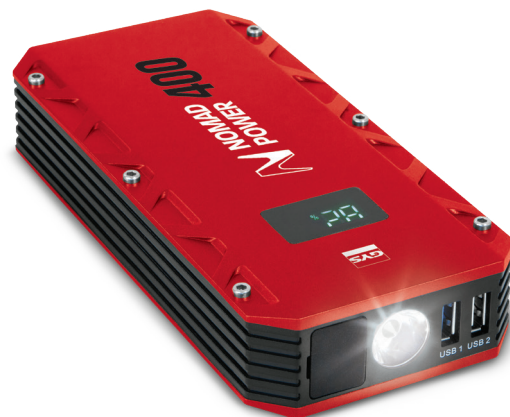
Ecrã a cores LCD

Muito leve (498 g) e compacto , cabe perfeitamente no porta-luvas do veículo, bem como numa mala de viagem.