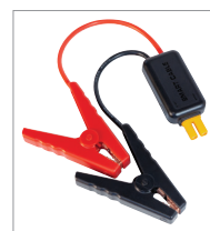
Cabo de arranque inteligente