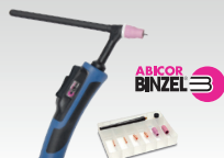
SR26DB - 8 m 038271