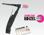
SR26L - 8 m 046184