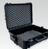
Mala de obras IP67 060432