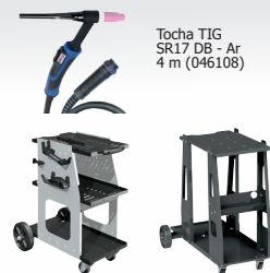
CARRINHO 4m 3 WELD 810 (037489)