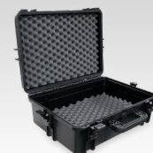
Кейс для работы на объектах IP67 060432