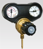
Regulátor 30 l/min